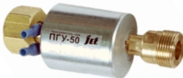
Подогреватель газа баллонный ПГУ-50