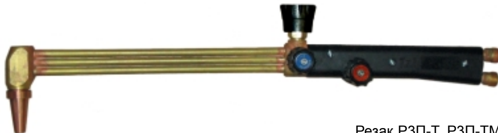
Резак РЗП-Т, РЗП-ТМ

РЗП-Т, РЗП-ТМ — универсальный ручной резак для различных областей применения. Резак выполнен по трёхтрубной схеме с внутрисопловым смешением газов. Горючий газ — пропан. Толщина реза в зависимости от комплектации — от 3 до 200 мм. Резак РЗП-Т — резак с кольцевым зазором мундштука; резак РЗП-ТМ — с щелевым мундштуком.