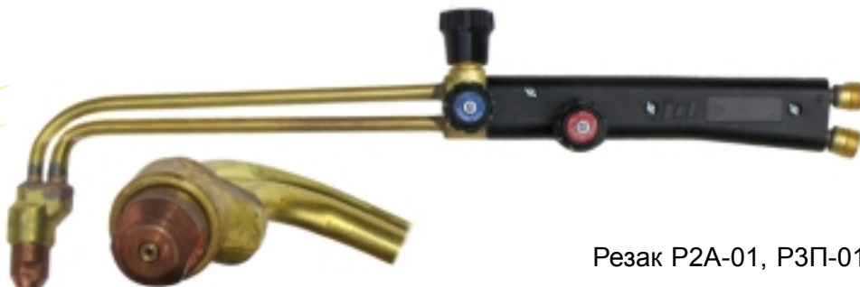
Резак P2A-01, P3П-01