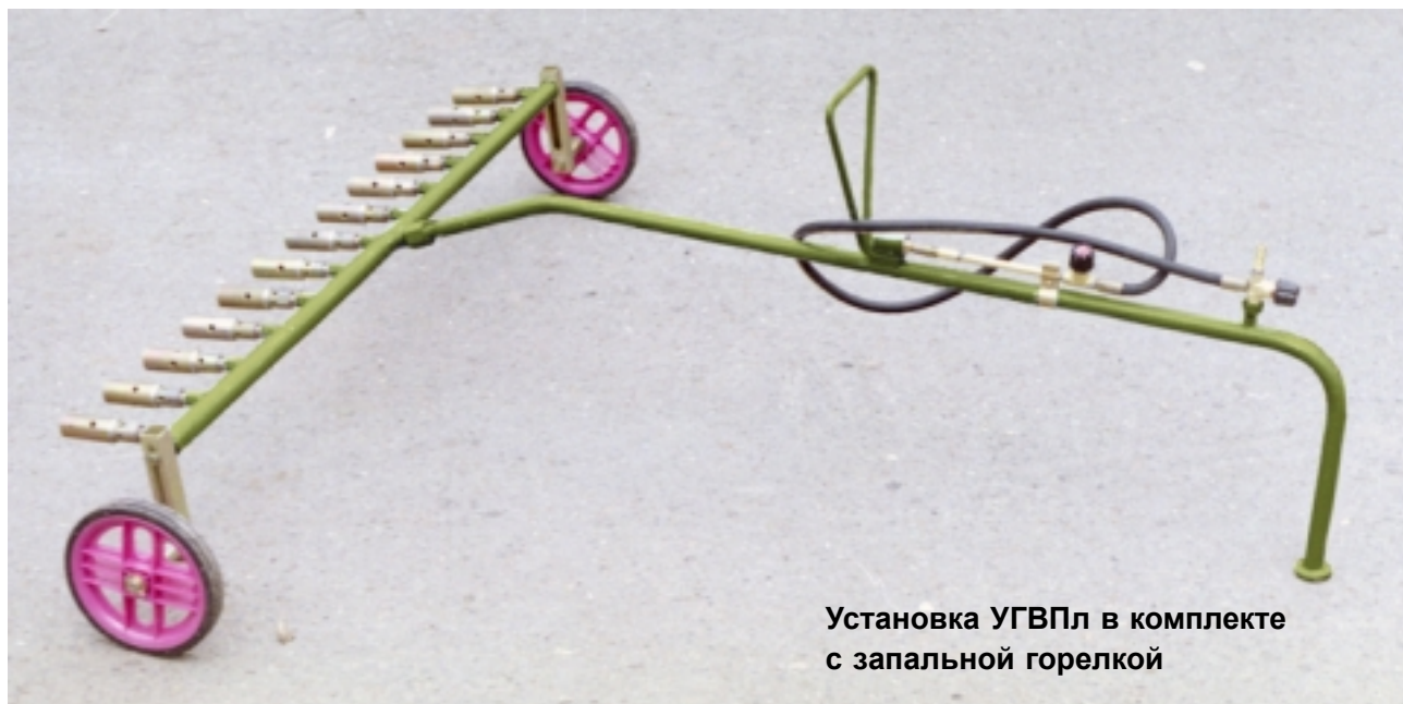
Установка УГВПл в комплекте с запальной горелкой

Газовоздушная многопламенная установка УГВПл предназначена для ремонта кровли из битумного рулонного материала. Рабочий газ — пропан. Воздух для горения инжектируется через отверстия в наконечниках.