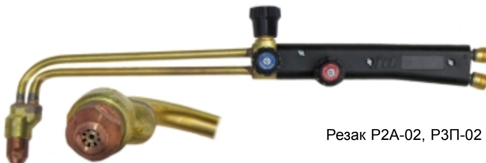
Резак P2A-02, P3П-02

P2A-01, P2A-02, P3П-01, P3П-02 — универсальный ручные резаки для различных областей применения. Горючий газ — ацетилен или пропан соответственно. Толщина реза в зависимости от комплектации — от 3 до 200 мм. На резаках P2A-01, P3П-01 применяются те же внутренние и наружные мундштуки, что и на P2A, P3П. На резаках P2A-02, P3П-02 используются мундштуки от резаков P2Пм и P3Пм соответственно.