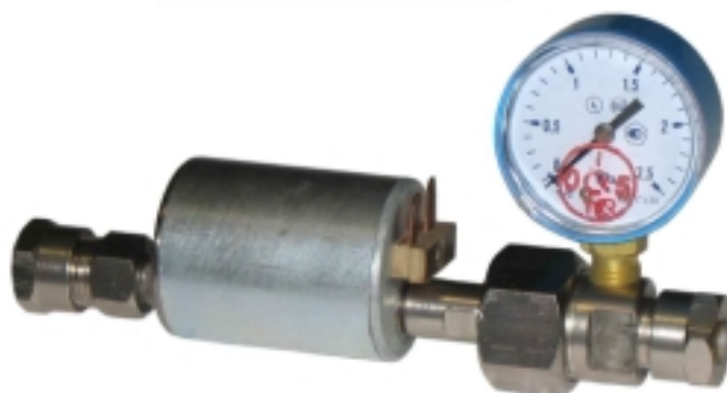
Подогреватель газа магистральный ПГУ-50