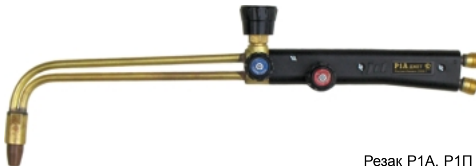
Резак P1A, P1П

Универсальный инжекторный резак P1A (P1П) предназначен для ручной кислородной резки углеродистых и низколегированных сталей, с использованием в качестве горючего газа ацетилена (P1A) или пропана (P1П). Резак предназначен для различных областей применения.